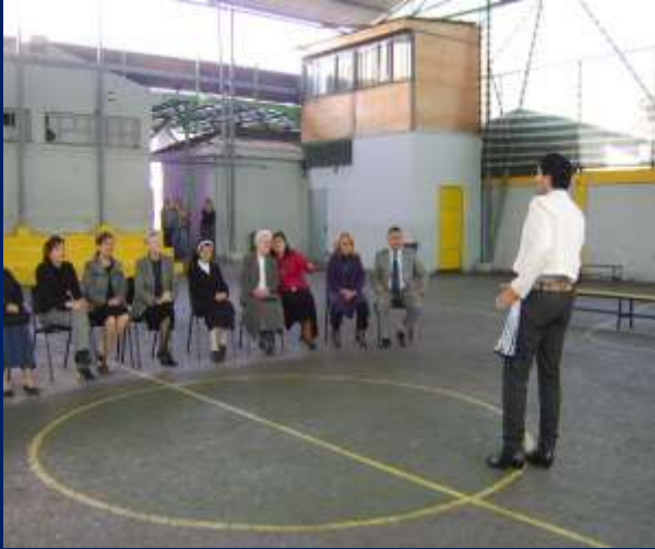
HUASO DANDO LA BIENVENIDA A LAS HNAS.