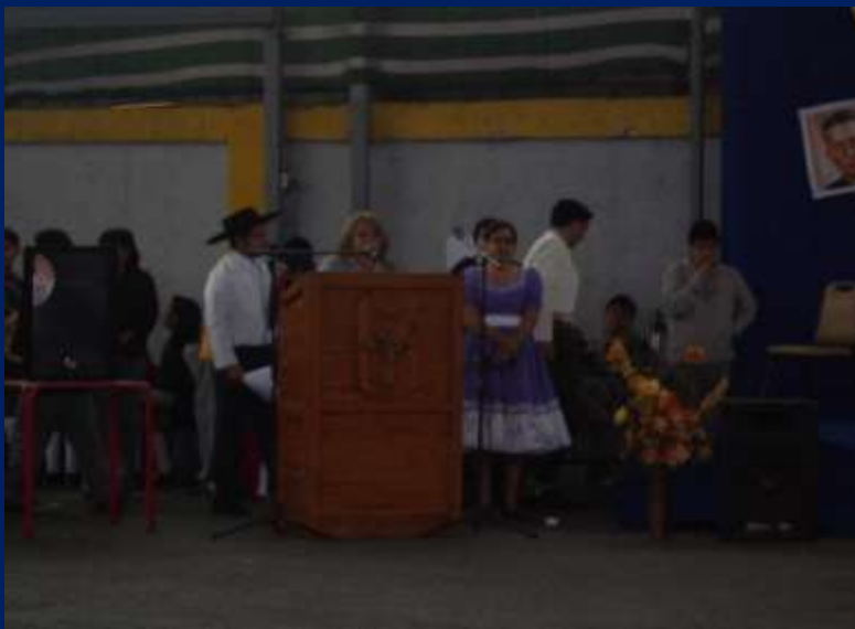
PALABRAS DE LA DIRECTORA AL FINALIZAR EL ACTO CONMEMORATIVO.