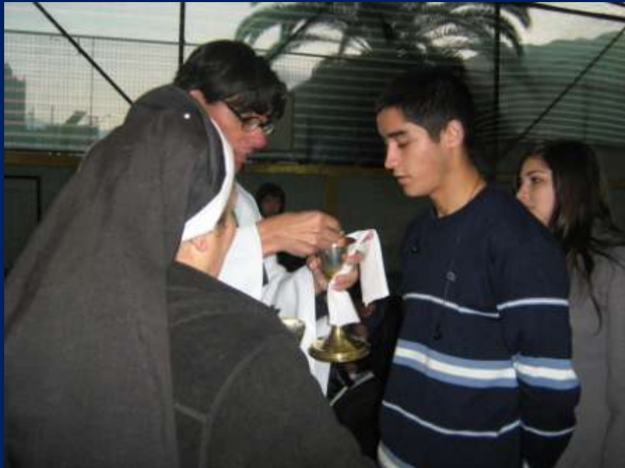
ESTUDIANTES RECIBIENDO EL CUERPO DE CRISTO