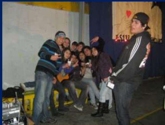
ESTUDIANTES EN LA VIGILIA EN UN MOMENTO DE RELAJO