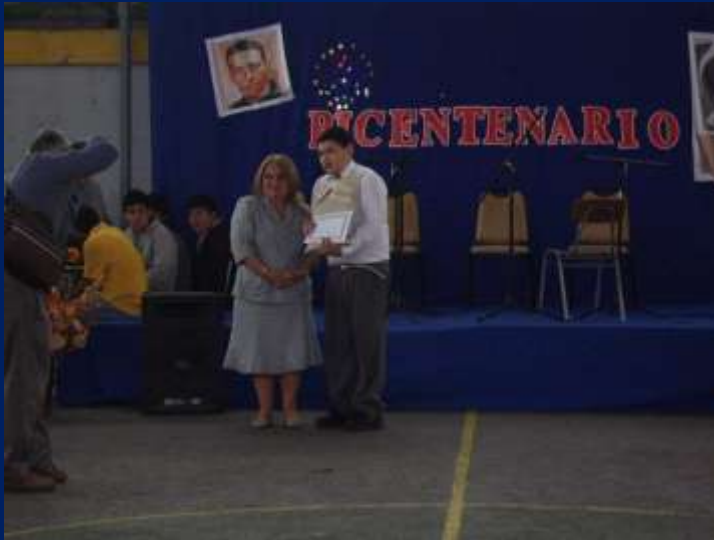
DIRECTORA PREMIANDO AL 3ER LUGAR DEL CONCURSO DE POESÍA.