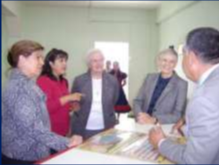
HNAS JUNTO A NUESTROS SOSTENEDORES, EN EL LABORATORIO DE CIENCIAS.