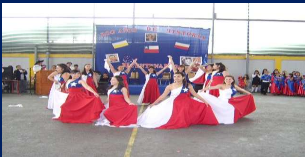
ESTUDIANTES DE LA ACADEMIA DE FOLCLOR DE EDUCACIÓN MEDIA