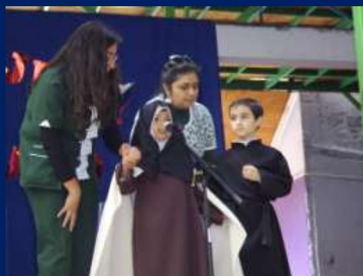
SANTA TERESA DE LOS ANDES Y SAN ALBERTO HURTADO