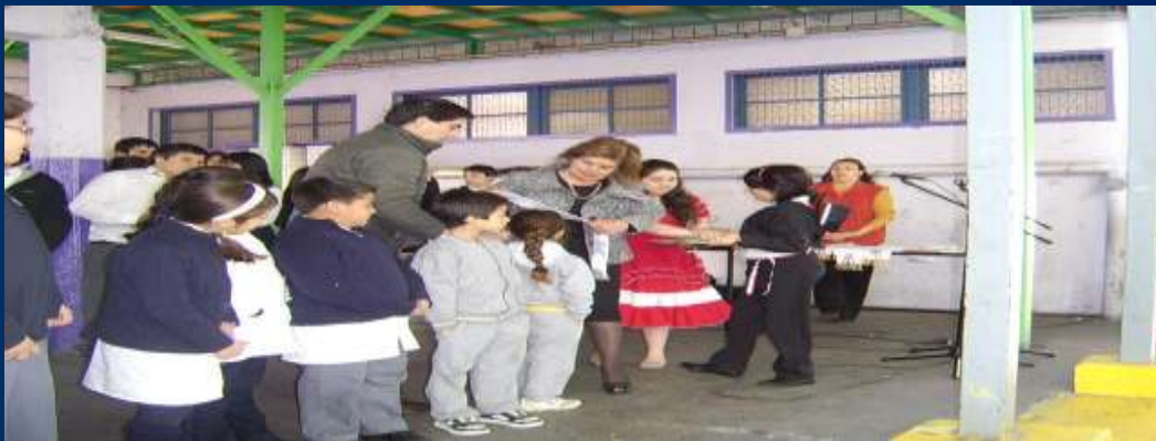
PREMIACIÓN CAMPEONATO DE CUECA COLEGIO PROVIDENCIA 2010