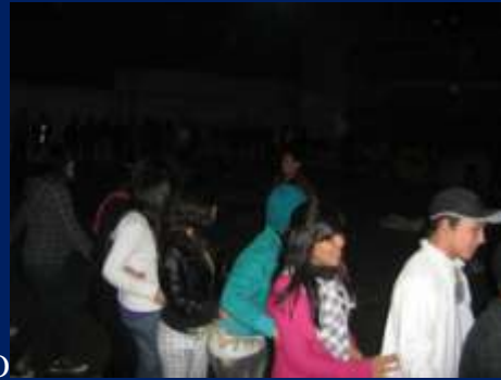
REALIZANDO DINÀMICAS DE GRUPO