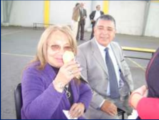
NUESTRA QUERIDA DIRECTORA DEGUSTANDO LA RICA CHICHA EN CACHO.