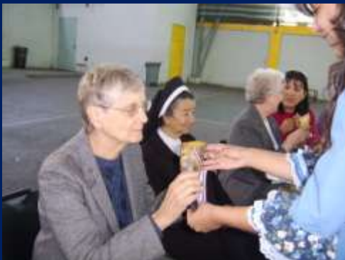
HNAS. PRIMERA VEZ QUE DEGUSTABAN LA CHICHA.