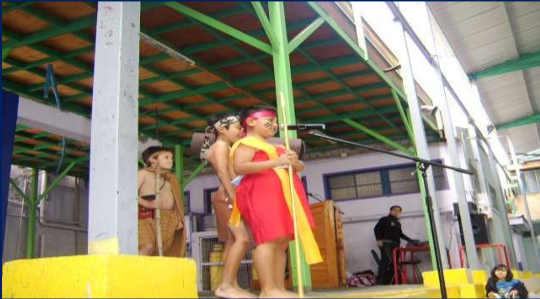
LOS 3 TOQUIS MAPUCHES MICHIMALONGO, LAUTARO Y CAUPOLICAN.