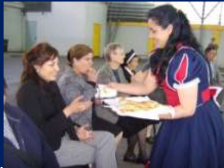
ASISTENTES COMIENDO EMPANADAS.