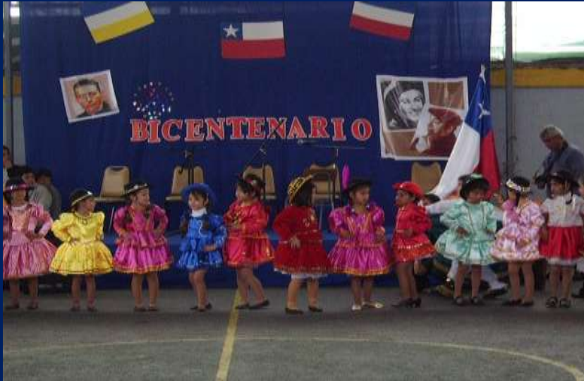
LA DIABLADA, PROVIDENCIANOS MÁS PEQUEÑOS.