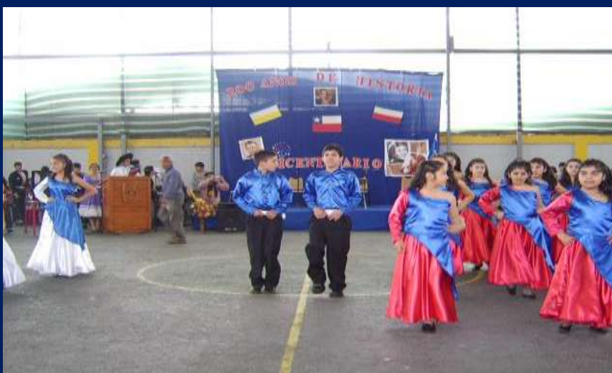
ESTUDIANTES DE LA ACADEMIA DE FOLCLOR DE EDUCACIÓN BÁSICA